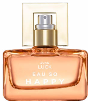
1480999 Парфюмерная вода Eau So Happy