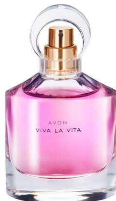
51609 Парфюмерная вода Avon Viva La Vita