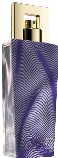
1464845 Парфюмерная вода Avon Attraction Game

розовый перец, горький шоколад, бархатистый древесный аккорд