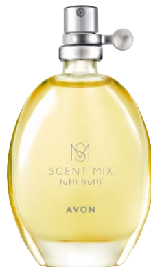
1369892 Туалетная вода Scent Mix Tutti Frutti