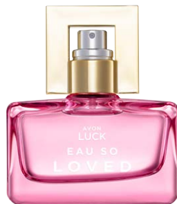
1481001 Парфюмерная вода Eau So Loved

черная смородина, цветки франжипани, дубовые ноты