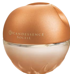
1465873 Парфюмерная вода Incandessence Soleil

черносмородиновый ликер, орхидея, пачули