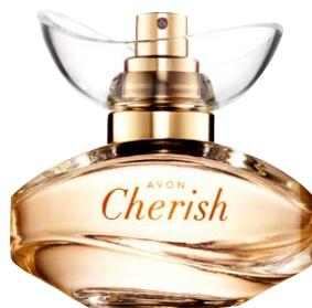
01851 Парфюмерная вода Avon Cherish