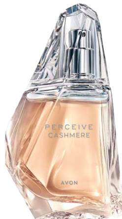
1481514 Парфюмерная вода Perceive Cashmere

персик, гардения, кашемировое дерево, Romandolide® (мягкая нота мускуса)