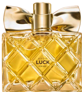
06229 Парфюмерная вода Avon Luck

красное яблоко, лепестки жасмина, аккорд Skin Feel