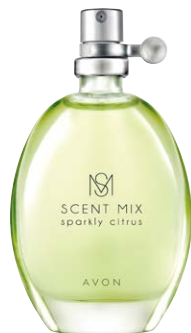
86277 Туалетная вода Sparkly Citrus