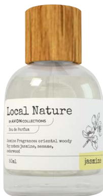
1437696 Парфюмерная вода Local Nature Jasmine