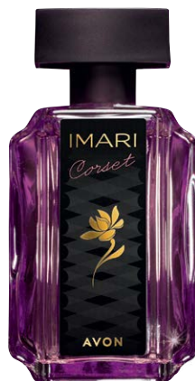
1420692 Туалетная вода Imari Corset

масло какао, сantalовое дерево, ноты кожи