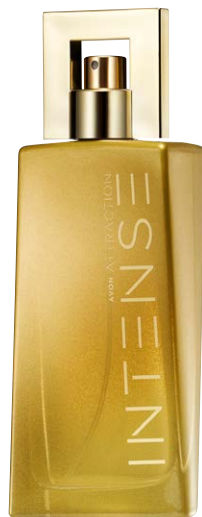
1519235 Парфюмерная вода Avon Attraction Intense

розовый перец, горький шоколад, бархатистый древесный аккорд