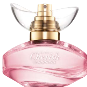
29957 Парфюмерная вода Avon Cherish The Moment

черносмородиновый ликер, орхидея, пачули