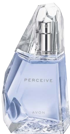
32150 Парфюмерная вода Perceive