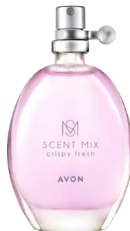
1478860 Туалетная вода Crispy Fresh