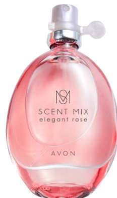
1437694 Туалетная вода Scent Mix Elegant Rose