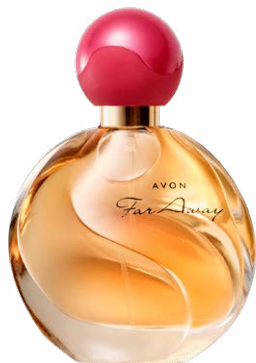
67249 Парфюмерная вода Far Away