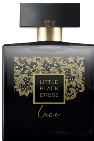
1481476 Парфюмерная вода Little Black Dress Lace