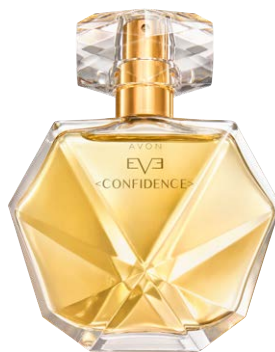
17879 Парфюмерная вода Avon Eve Confidence

черная смородина, цветки франжипани, дубовые ноты