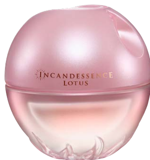
99194 Парфюмерная вода Incandessence Lotus