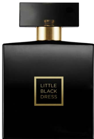
1480996 Парфюмерная вода Little Black Dress