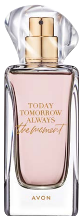
1477433 Парфюмерная вода The Moment