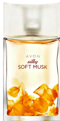
82271 Туалетная вода Soft Musk Silky

водяная лилия, мадагаскарская ваниль, мускус