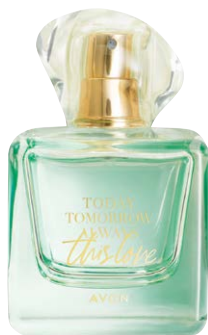
1400999 Парфюмерная вода This Love