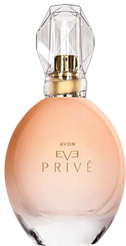
1468728 Парфюмерная вода Avon Eve Prive

красное яблоко, лепестки жасмина, аккорд Skin Feel