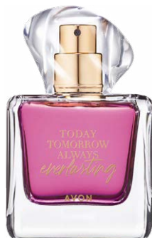
1554554 Парфюмерная вода Everlasting