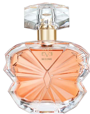
1504460 Парфюмерная вода Avon Eve Become