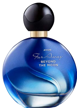
1518113 Духи Far Away Beyond The Moon