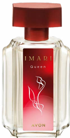
1514232 Туалетная вода Imari Queen

ежевика, королевская роза, мускусно-анисовая эссенция