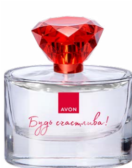
1465873 Парфюмерная вода «Будь счастлива!»

малиновый нектар, роза, кашемировое дерево