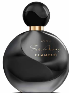
67242 Парфюмерная вода Far Away Glamour

аккорд белого удового дерева, черная слива, ваниль