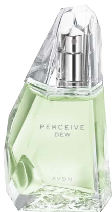
1487916 Туалетная вода Perceive Dew