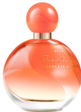
1501369 Парфюмерная вода Far Away Endless Sun

искристый бергамот, ночной цереус, теплый сандал