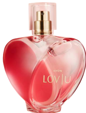
1502904 Парфюмерная вода Lov U

малиновый нектар, роза, кашемировое дерево