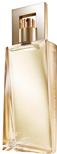
17753 Парфюмерная вода Avon Attraction