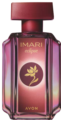
1472688 Туалетная вода Imari Eclipse