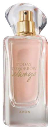
1400980 Парфюмерная вода Always

спелая малина, африканская фиалка, амбра