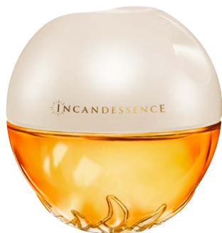
26640 Парфюмерная вода Incandessence