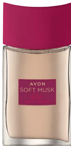
1422710 Туалетная вода Soft Musk Velvet Berries