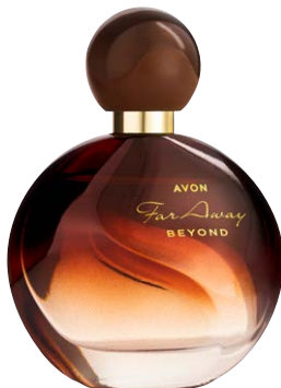
1422708 Духи Far Away Beyond