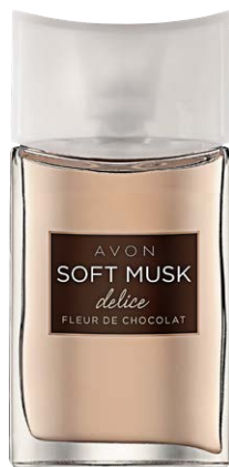
07795 Туалетная вода Soft Musk Delice

шоколадный аккорд, майский ландыш, ваниль