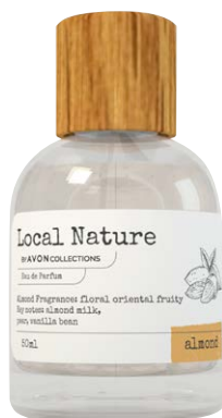
1437697 Парфюмерная вода Local Nature Almond