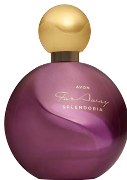
1475248 Парфюмерная вода Far Away Splendoria

аккорд белого удового дерева, черная слива, ваниль