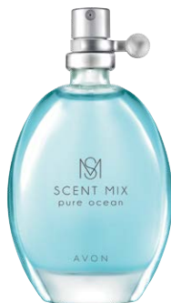
58402 Туалетная вода Pure Ocean