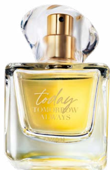
1400986 Парфюмерная вода Today