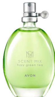
1437693 Туалетная вода Fizzy Green Tea