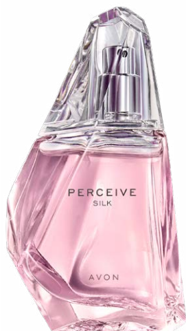
1434480 Парфюмерная вода Perceive Silk