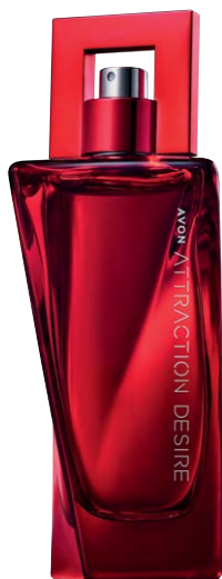
1406445 Парфюмерная вода Avon Attraction Desire