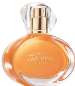
1400990 Парфюмерная вода Tomorrow

спелая малина, африканская фиалка, амбра