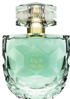
77802 Парфюмерная вода Avon Eve Truth

магнетит, бутон черной смородины, розовая фрезия, кедр