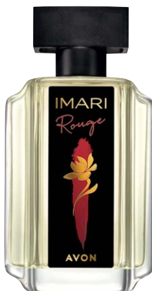
1420694 Туалетная вода Imari Rouge

шоколадный аккорд, майский ландыш, ваниль