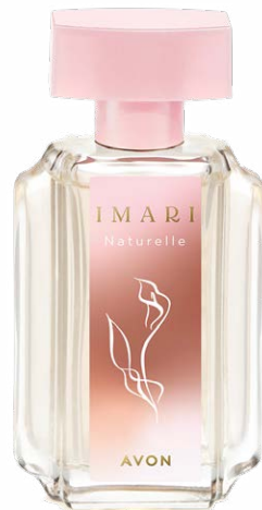
1540065 Туалетная вода Imari Naturelle

ежевика, королевская роза, мускусно-анисовая эссенция