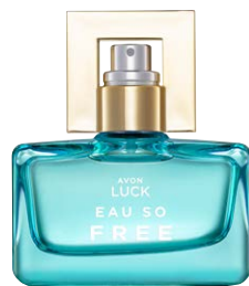
1481107 Парфюмерная вода Eau So Free

магнетит, бутон черной смородины, розовая фрезия, кедр