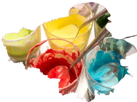
Следы пищевого красителя на кухонной поверхности