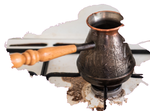
Сбежавший на плиту кофе