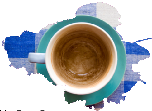
Чайный налет на термосе или чашке